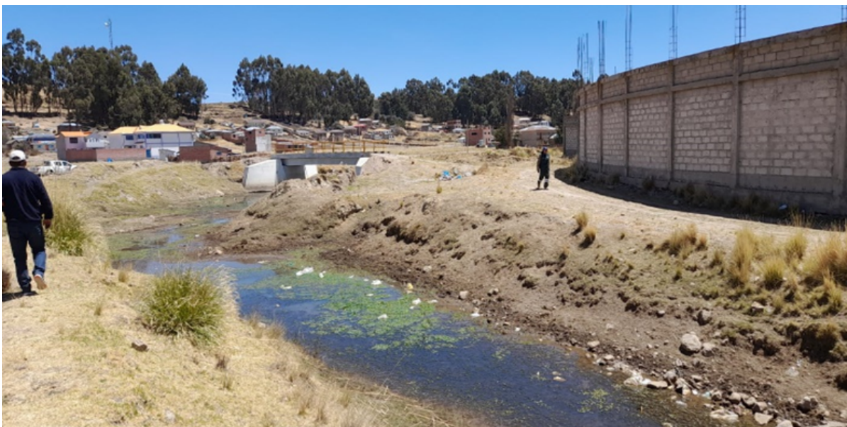
FIGURA N°01: TRAMO CRÍTICO EN EL CAUCE DEL RIO HUACUYO (UNICACHI) COLMATADO Y DIQUE DETERIORADO AGUAS ABAJO DEL TRAMO DE LA CARRETERA YUNGUYO - UNICACHI, DEL AMBITO JURISDICCION DEL DISTRITO DE UNICACHI, PROVINCIA DE YUNGUYO - PUNO.