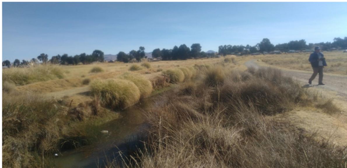
FIGURA N°03: TRAMO CRÍTICO EN EL CAUCE DEL RIO HUACUYO (UNICACHI) COLMATADO, TRAMO DEL AMBITO JURISDICCION DEL DISTRITO DE UNICACHI, PROVINCIA DE YUNGUYO - PUNO.