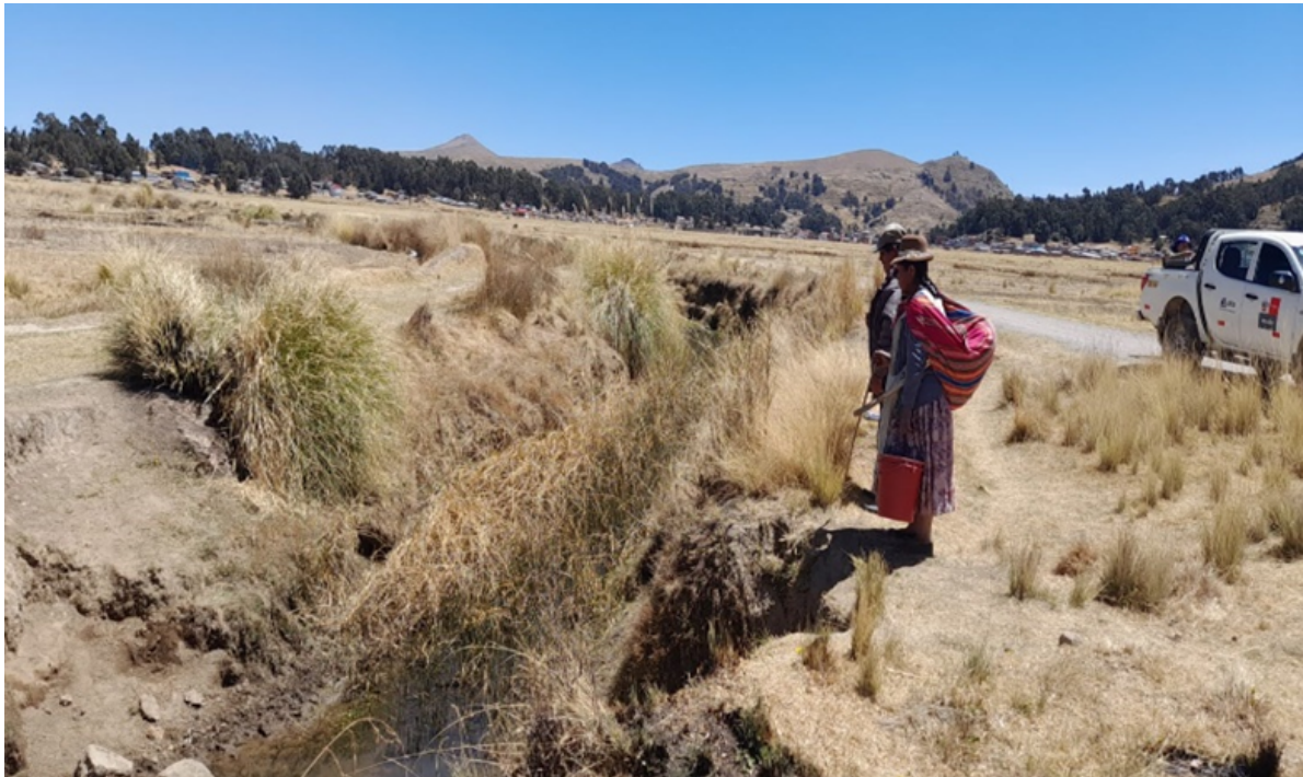
FIGURA N°02: TRAMO CRÍTICO EN EL CAUCE DEL RIO HUACUYO (UNICACHI) COLMATADO, TRAMO DEL AMBITO JURISDICCION DEL DISTRITO DE UNICACHI, PROVINCIA DE YUNGUYO - PUNO.